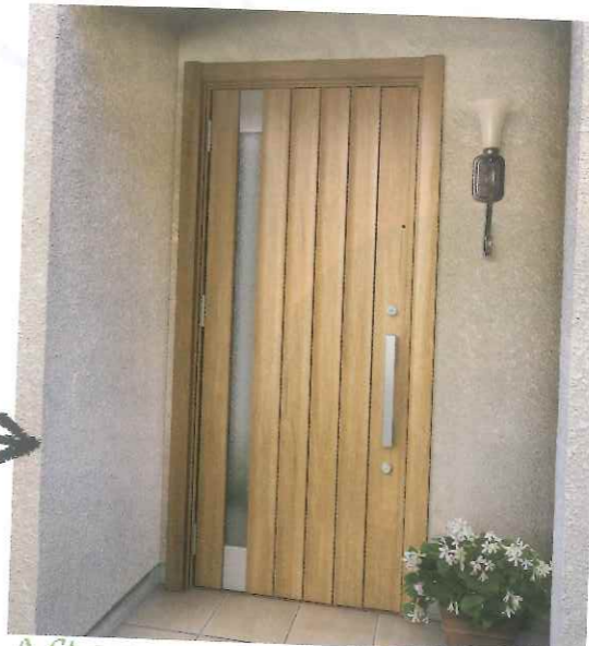
After P77型シュガーオーク F型ハンドル 片開き