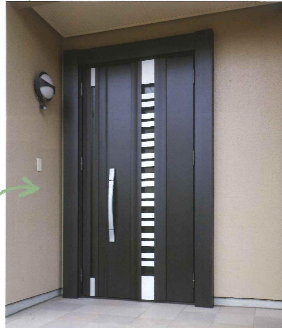
G82型(採風タイプ) トリノバイン S型ハンドル 親子