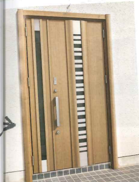
After 682型クリエラスク F型ハンドル 親子