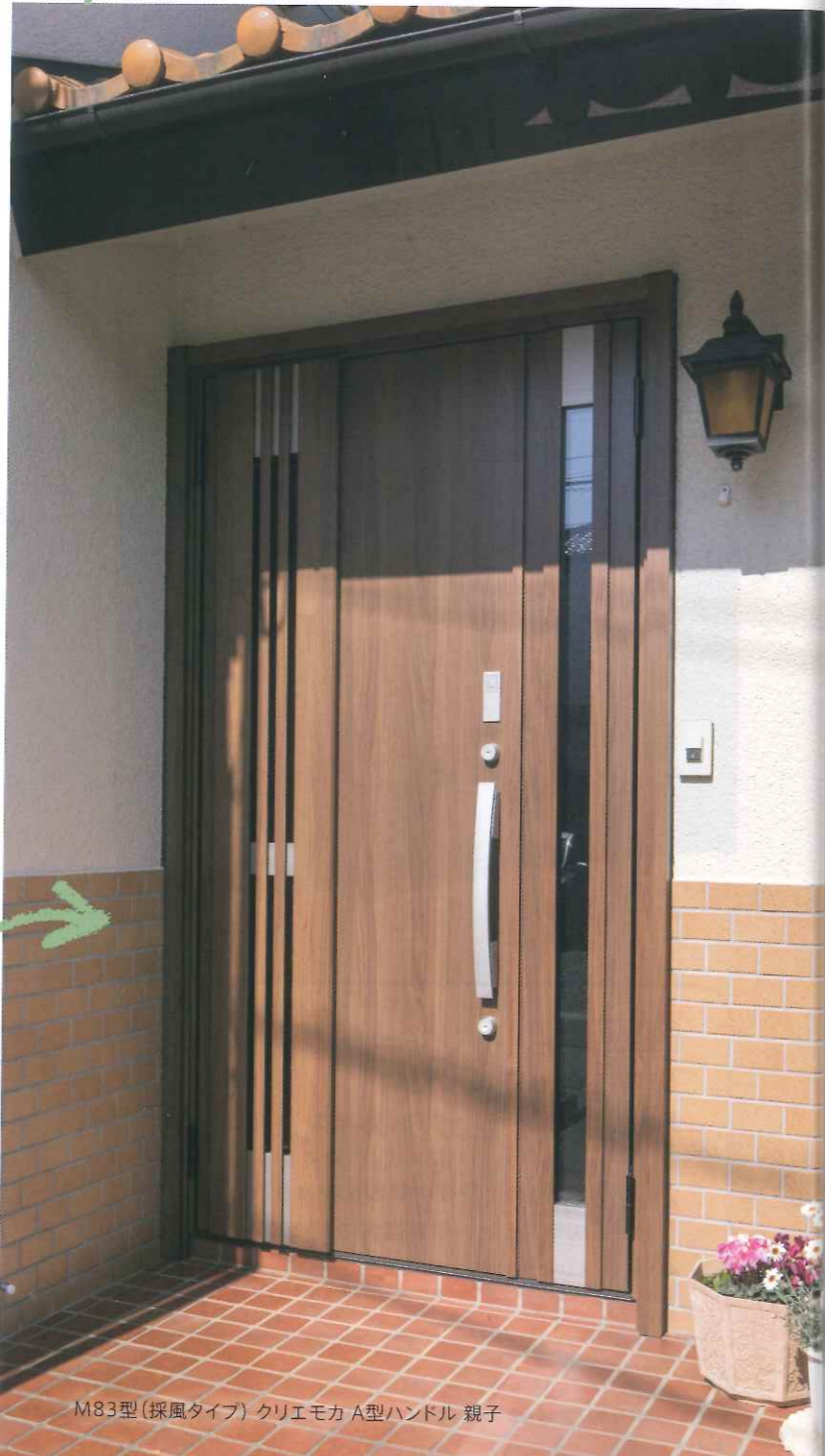
M83型(採風タイプ) クリエモカ A型ハンドル 親子