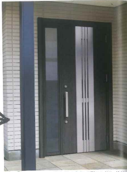
After M84型トリノパイン F型ハンドル 片袖