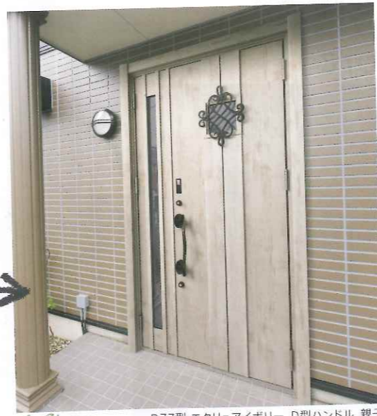
After D77型エクリュアイボリー D型ハンドル 親子