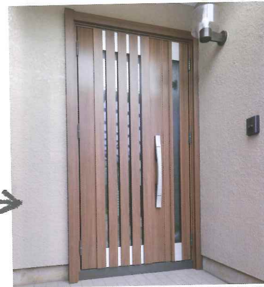
After M27型クリエモカ S型ハンドル 親子