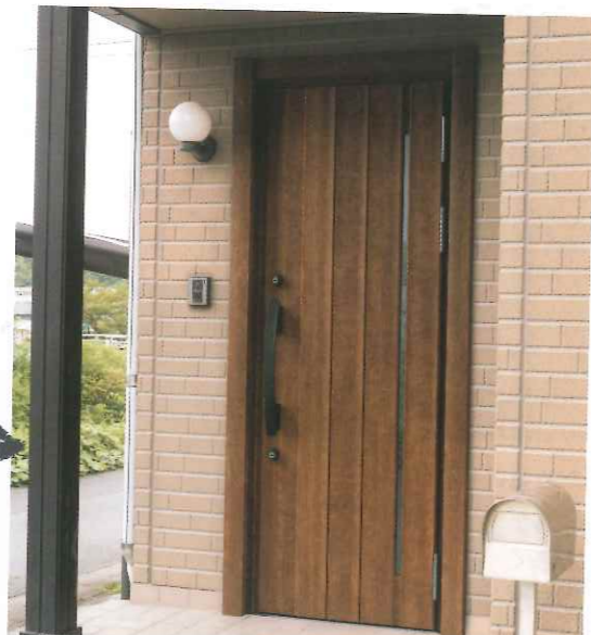
After 71N型ハンドダウンチェリー A型ハンドル 片開き