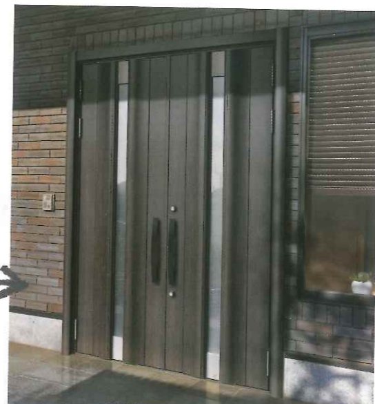
After 12N型クリエダーク A型ハンドル 両開き