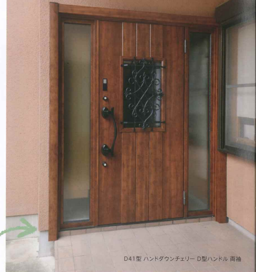
D41型 ハンドダウンチェリー D型ハンドル 両袖